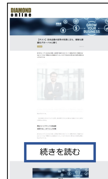
冒頭部分：一般公開